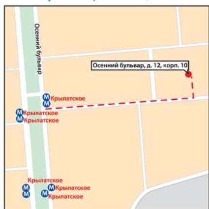
м. «Крылатское», ул. Осенний бульвар, д. 12, корп. 10