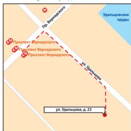
м. «Проспект Вернадского», ул. Удальцова, 23