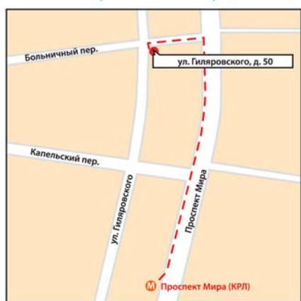
м. «Проспект Мира», ул. Гиляровского, 50