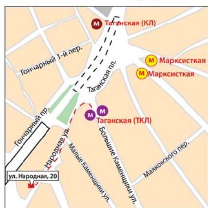
м. «Таганская», ул. Народная, 20