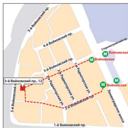
м. «Войковская», 5-й Войковский пр-д, 12