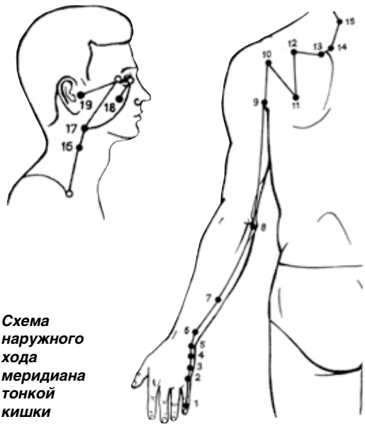
Схема наружного хода меридиана тонкой кишки

Время активности меридиана сердца в 11–13 часов, тонкого кишечника – 13–15 часов. Если сердечно-сосудистая система в порядке, в эти часы можно позволить себе любые возможные для здорового организма физические и эмоциональные нагрузки (экзамены, переговоры, спорт, физический труд и т. д.). При недостатке энергии тонкого кишечника в эти часы человек ощущает общую слабость, повышенную потливость, онемение в ко-