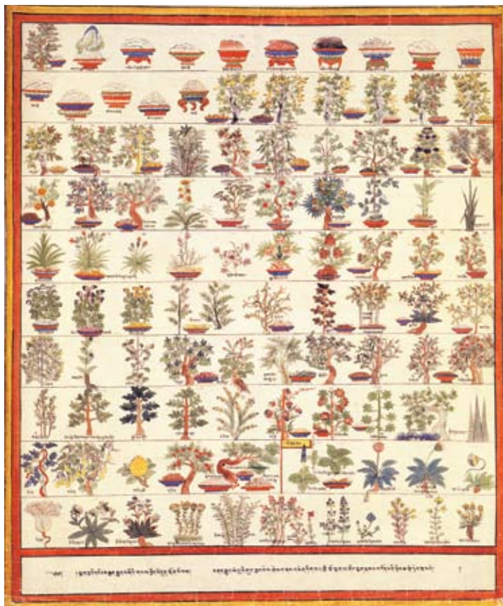
Лекарственные растения в Атласе тибетской медицины

В медицинской литературе Тибета описано более 114 видов минерального сырья и около 150 средств животного происхождения, применяемых при приготовлении лекарств. В многокомпонентных лекарственных средствах содержится примерно от 3 до 100 ингредиентов в одном составе. И все же тибетская фармакология более известна как уникальная система лечения преимущественно травами. Существует около 1300 лекарств из растений, ставших классическими, и которые зафиксированы в древних рецептурниках. Все эти ле-