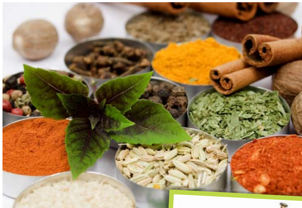
Все разнообразие вкусов – в специях и пряностях. Во времена наших предков они ценились на вес золота.

Действительно, вкус любого сладкого продукта можно изменить, добавив соли, перца, приправ, соусов, специй.