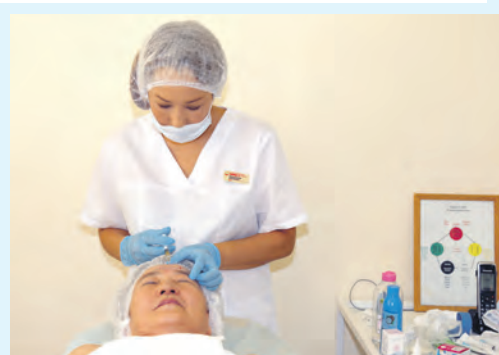
ВО ВРЕМЯ ПРОЦЕДУРЫ