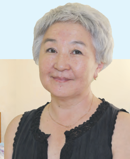
РЕЗУЛЬТАТ ПОСЛЕ ПРОЦЕДУРЫ

Записаться на прием по телефону: 8 495 180-04-43